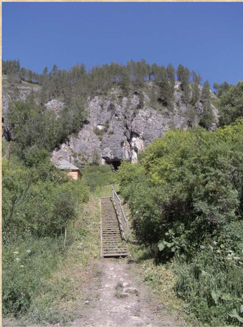
ロシア・アルタイ地方のデニソワ洞窟