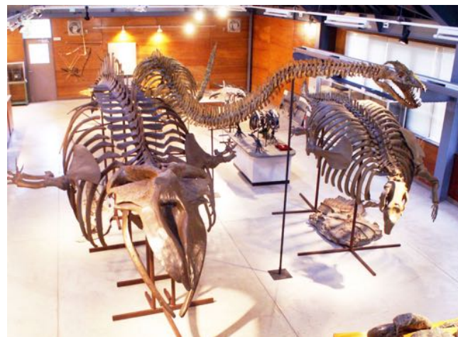
写真2 展示室の様子。左からクジラ、クビナガリュウ、カイギュウ