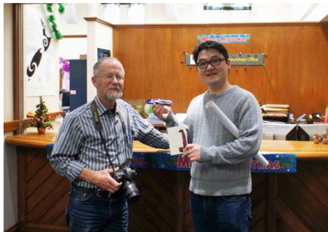
写真1 指導教官 R. Ewan Fordyce 教授（左）と著者（右）。博士論文提出。

情報；沼田町化石館は冬季休館します。2015年の開館は4月29日から11月までです。詳しくは0164-35-1034（電話）か「沼田町化石館」で検索してください。