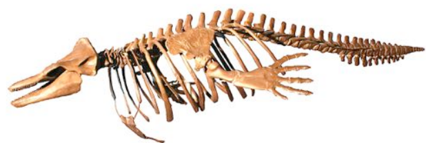
写真3 ヌマタネズミイルカの骨格