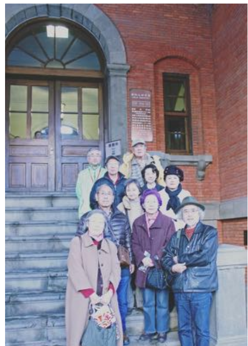
赤れんが庁舎入口階段で記念撮影 筆者は前列左端

案内していただくと「内容がすばらしくなるよね」と参加された皆様は見学会に感謝していました。ありがとうございました。赤れんが庁舎の入口階段で記念の撮影をしました。