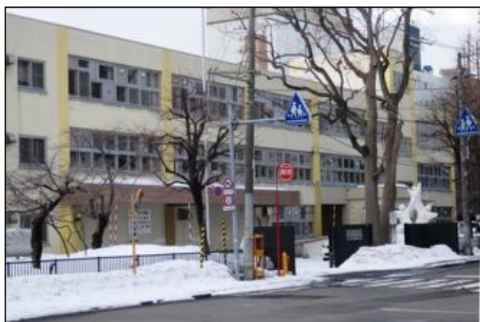
札幌市公文書館(旧豊水小学校)

その他、旧琴似村・旧円山村・旧白石村などからの公文書も、保存されているとのこと。