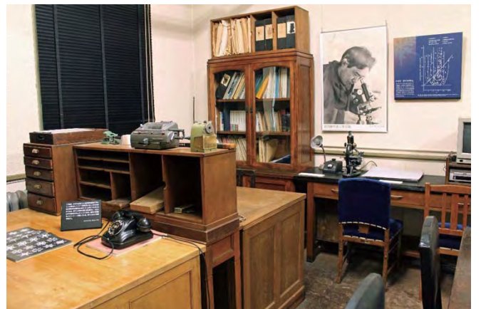
北大旧理学部(現総合博物館)教授室 N123 室に復元された中谷宇吉郎研究室