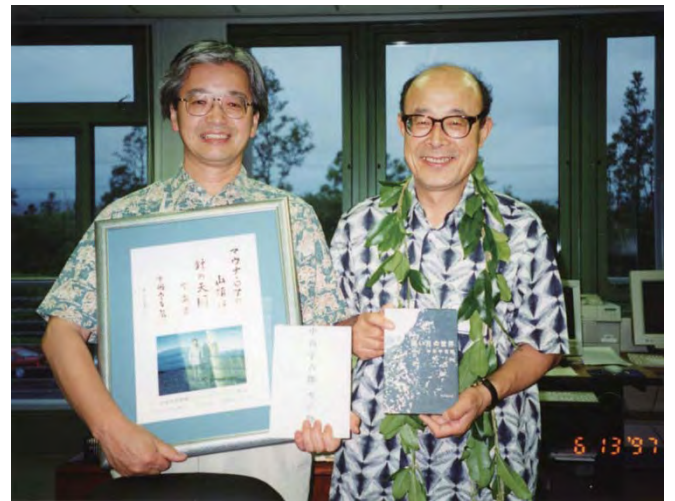
著者影像(右) ハワイ観測所にて、海部宣男観測所長(左)とともに。