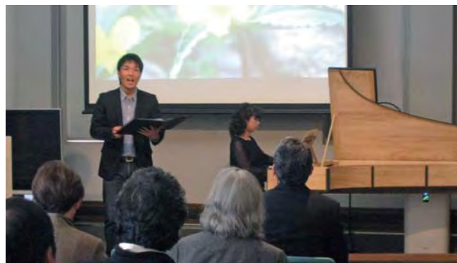
Le violette を演奏する新妻さんと歌う筆者。実は、練習では毎回失敗していたため、とても緊張しながらの本番でした(笑)

Rugiadose, odorose violette graziose 露に濡れ、香るかわいらしいスマレよ voi vi state vergognose お前たちは恥じらい、 mezzo ascose fra le foglie 草の間に身を隠して e sgridate le mie voglie che son tropp' ambiziose あまりに野心に満ちた私の望みを怒っている