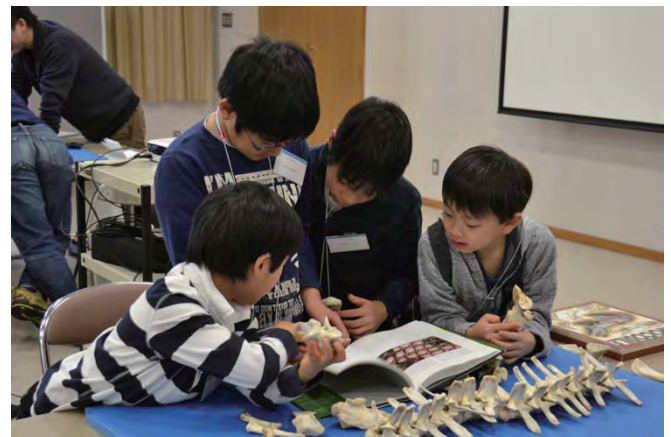
ワニの骨を観察して、体の部位の違いによる骨の違いを考える子供達

施設が協力している例として、2月2日に円山動物園で行われた恐竜グループの活動を報告します。円山動物園ではワニが飼育されていて、ワニの体の構造や生態を知ることで恐竜について理解を深めてもらう目的で一般の人に向けたイベントが行われました。