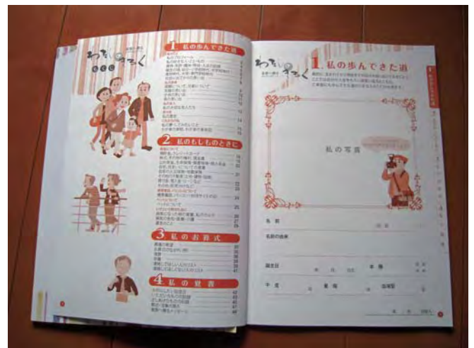
田村講師から戴いた『家族へ贈るエンディングノート、私の記録』

首都圏では火葬場の能力の問題から葬儀自体が時間待ち、日数待ちを強いられることが発生している。事情は違うが3.11の震災では止むなく土葬にせざるを得ない状況が生じていた。