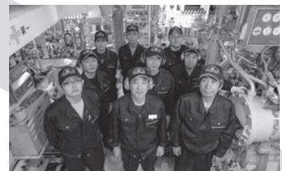
機関部員の集合写真 平成25年度北洋航海