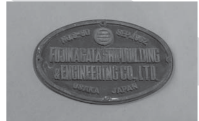
おしよろ丸III世の銘板