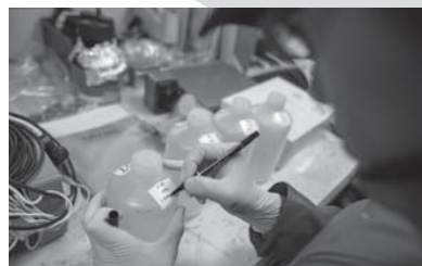
採水ボトルへラベルを貼る研究者 平成25年度北洋航海