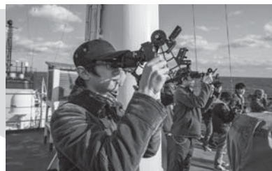
六分儀の使用方法を学ぶ学生たち 平成25年度太平洋・父島周辺海域航海