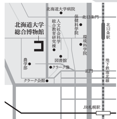
北海道大学総合博物館