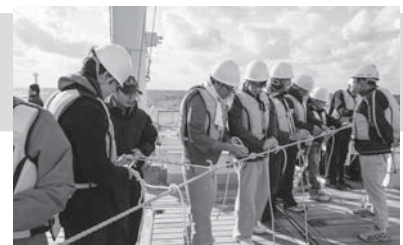
ロープワーク実習の様子 平成25年度太平洋・父島周辺海域航海