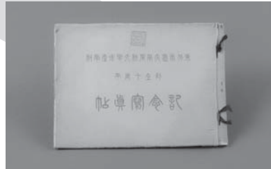
東北帝国大学農科大学水産学科創立十周年記念写真帖