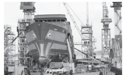
おしよろ丸V世建造風景 三井造船株式会社 玉野事業所