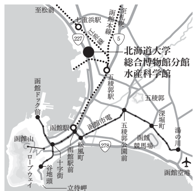
北海道大学総合博物館分館 水産科学館