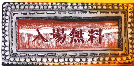
イラスト: 大通高校 中田小百合